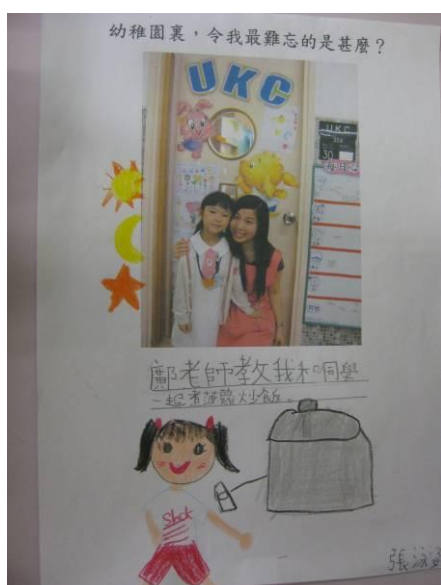
“謝謝鄺老師對我的教導”