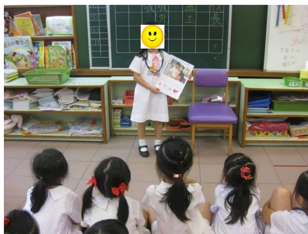
幼兒樂意與同伴進行分享