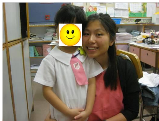
“我最喜歡低班的蘇老師”