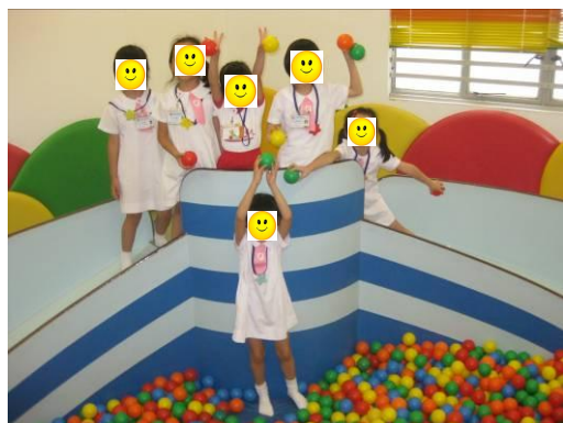
“我最喜歡到「波波池」玩耍”